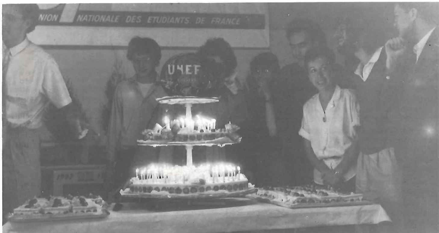
80 e anniversaire de l'UNEF : le 10 mai 1987 à MONTREUIL

Très vite c'est le grand mouvement vainqueur de l'automne.